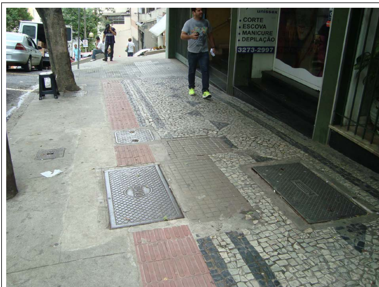
Figura n. 1: Exemplo de calçada em Belo Horizonte.

Ainda como crítica ao resultado deve-se citar o baixo padrão de execução, causado principalmente pela combinação entre a economia de recursos utilizados - uma vez que a reconstrução é obrigatória em toda obra que interfira na calçada e, quase sempre, tratado do modo menos oneroso possível para o proprietário ou concessionária - e pela falta de capacitação da mão de obra em relação ao mosaico de pedra portuguesa. As consequências desta má execução são as patologias recentes na maior parte das calçadas, descontinuidades (cunhas, degraus, incompatibilidades com acessos), emendas e interface entre materiais mal executadas.