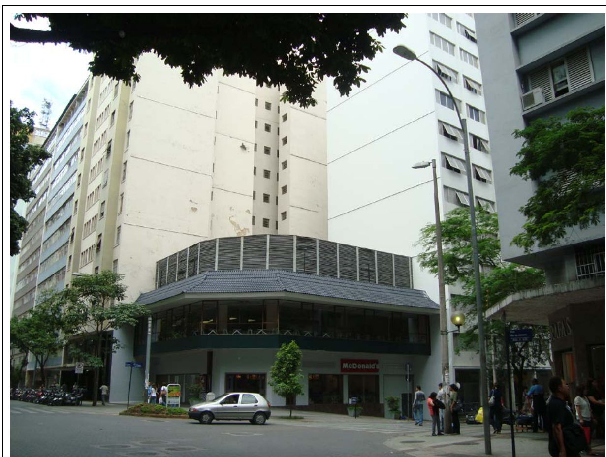
Figura n. 1: Iluminárias em Belo Horizonte.

com design aleatório que contradiz todo o discurso de padronização e integridade do projeto contratado.