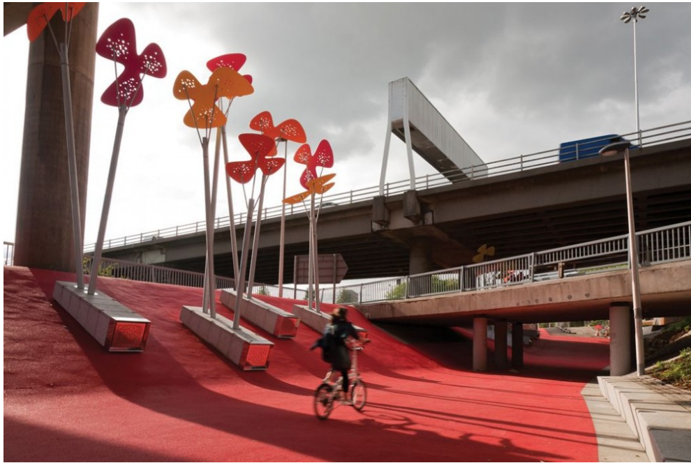
Figura n. 4: Garscube Link .

contrário, destacam a rota pela cor e pelo mobiliário urbano, potencializando-a como lugar do encontro social e da conexão espacial entre pontos da cidade.